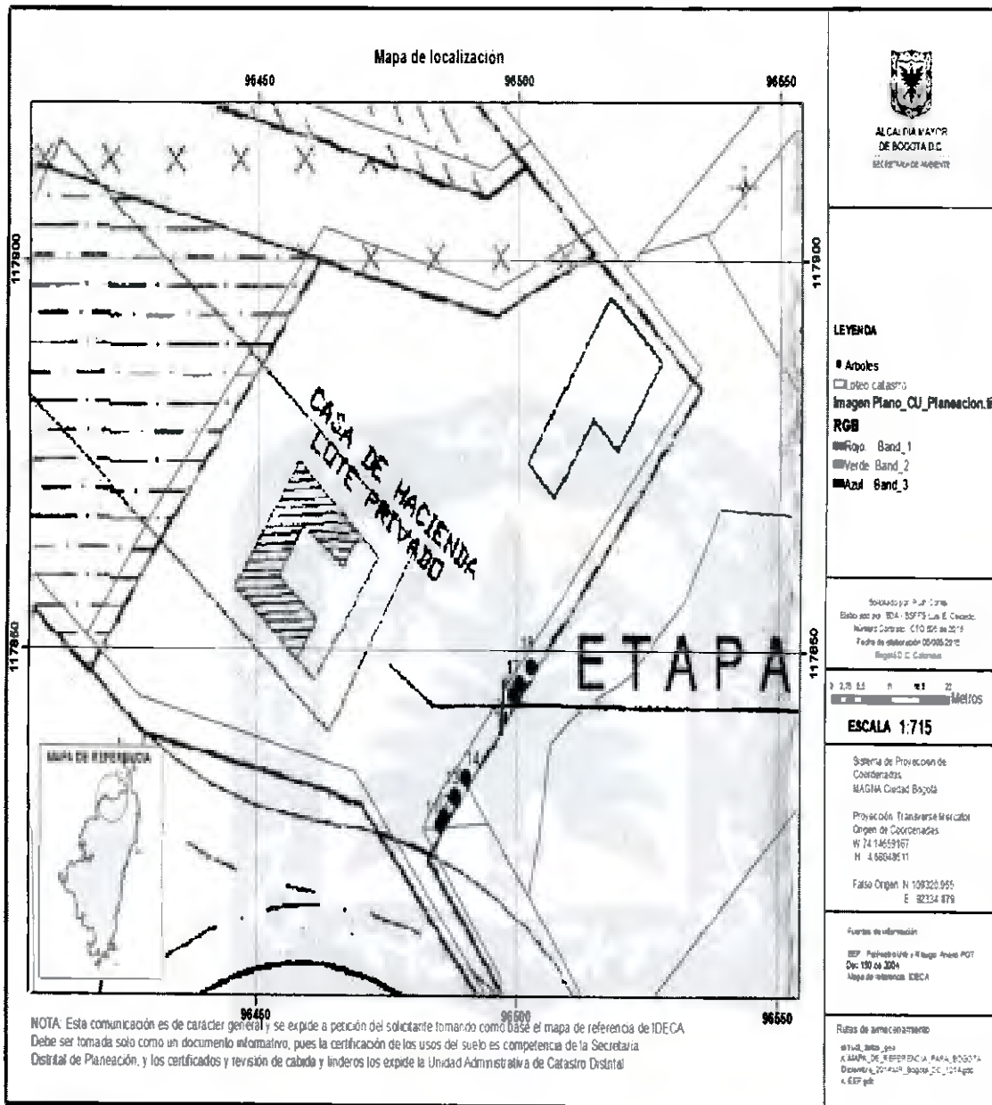
Imagen No. 2 Acercamiento de la plancha anterior, que se centra en lote Fontanar del Río (Casa de hacienda lote privado)

Expediente: S. J. de Contratos, Expediente: 00000111